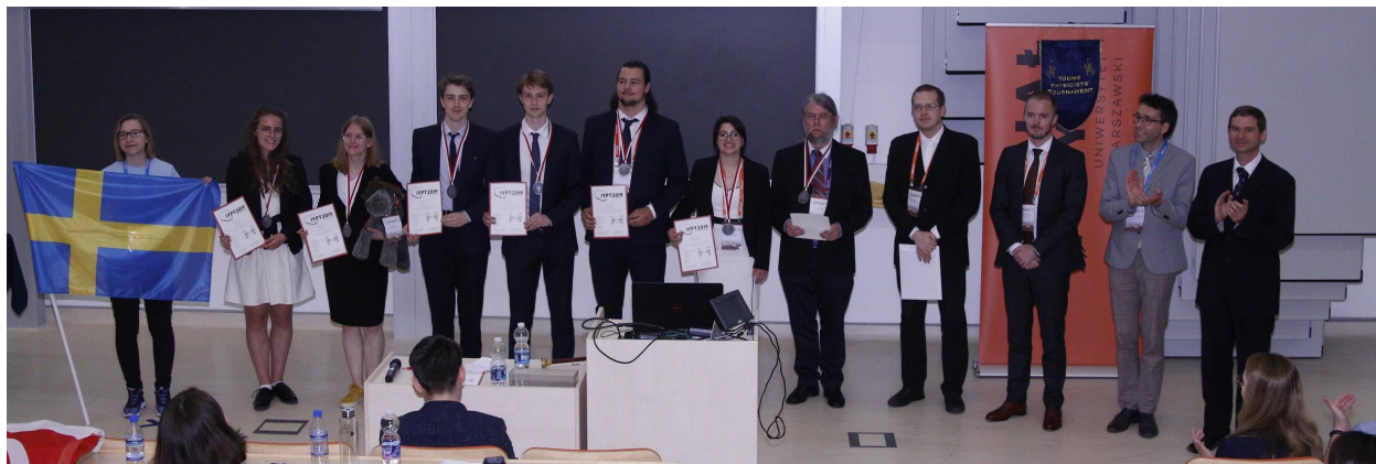
Bildtext: Det svenska laget från 2019 i Polen.

IYPT Sweden är en ideell förening som ansvarar för det svenska deltagande i en internationell fysikturnering för gymnasieelever - the IYPT (International Young Physicists tournament - www.iypt.org ). Tävlingsens syfte är att uppmuntra till att fler engagera sig i fysik/teknik genom ett undersökande arbetssätt och att muntligt försvara sina lösningar. Tävlingen startas på 80-talet och engagerar numera ett 30-tal länder över hela jorden. Varje år, i slutet av sommaren publiceras 17 nya öppna problem i fysik. Elever på gymnasiet väljer sedan ett problem, försöker lösa det experimentellt, jämför sina resultat med teorin och presenterar och försvarar sin lösning i en fysikduell. Varje deltagare måste också opponera på en annan elevs arbete. En jury av fysiker bedömer sedan hur väl man har presenterat respektive opponerat och efter ett antal "ronder" koras en vinnare. Tävling IYPT är unik eftersom man tränar eleverna att presentera och argumentera muntligt och att arbeta i team, egenskaper som är viktiga för livet efter skolan. På vår hemsida www.iypt.se om du vill veta mer om tävling och vår förening.